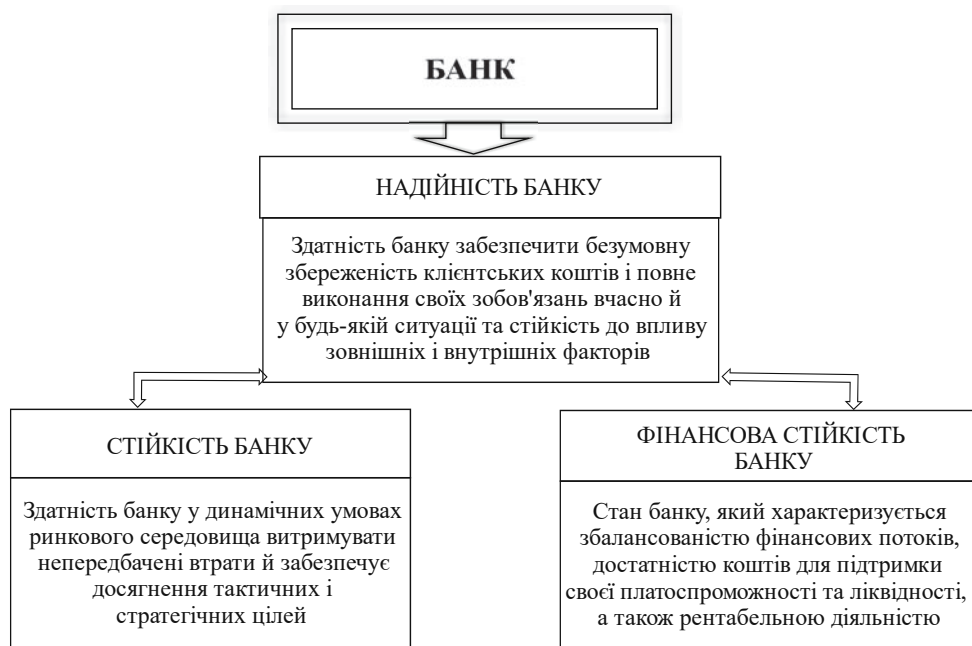
Рис. 1. Взаємозв'язок економічних категорій комерційного банку*

Отже, проведений аналіз категорій стійкість та надійність комерційного банку дали змогу нам виявити взаємозв'язок між цими економічними категоріями (рис. 1).