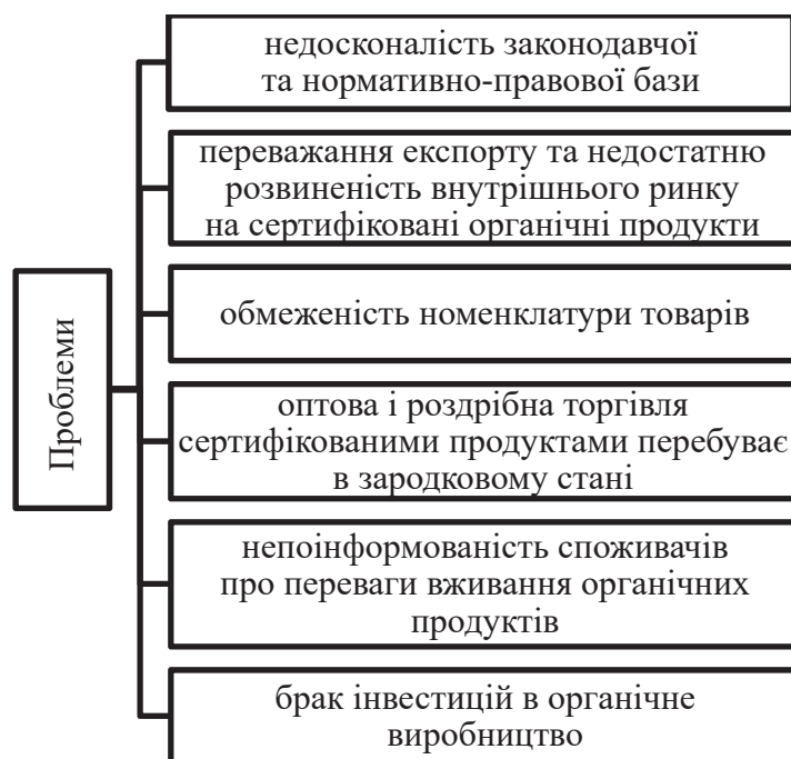
Рис. 1. Проблеми, які перешкоджають розвитку та функціонуванню органічного сільськогосподарського виробництва