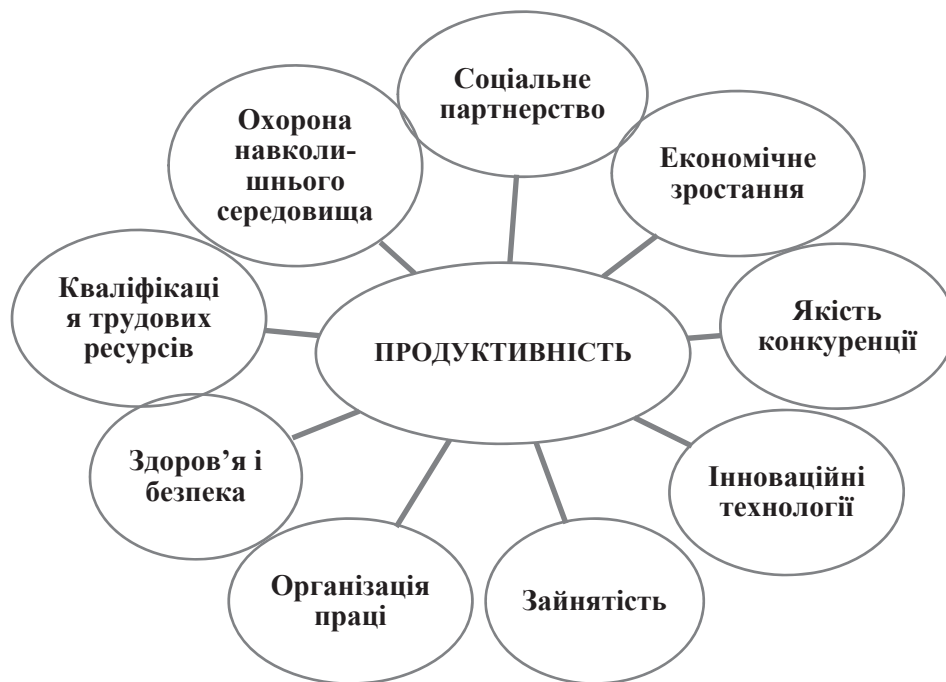
Рис. 2. Ключові сфери забезпечення зростання продуктивності