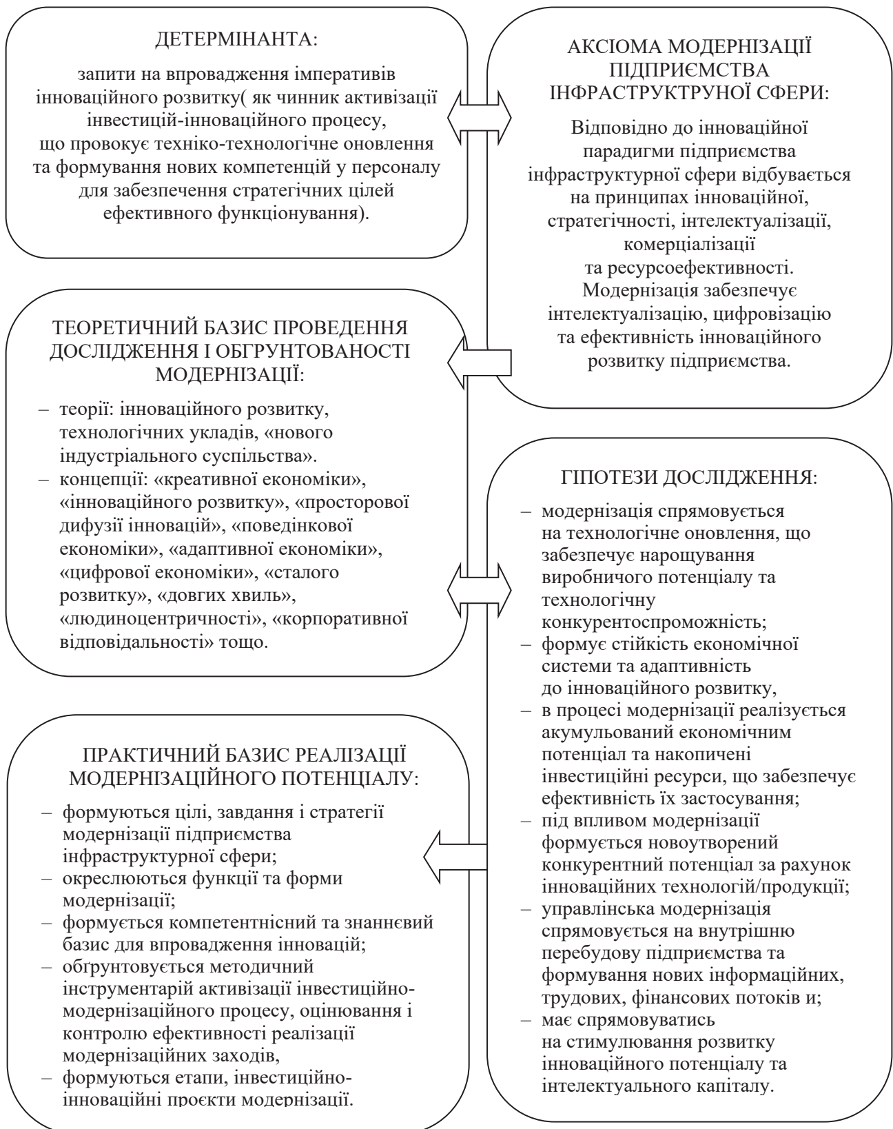
Рис. 1. Методологічні засади формування економічного механізму модернізації підприємства