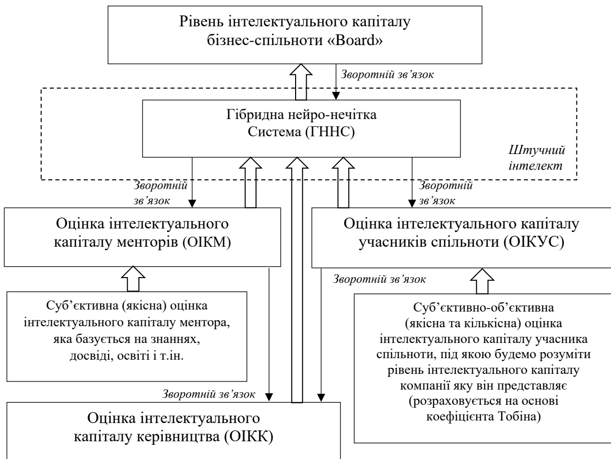
Рис. 1. Модель оцінки інтелектуального капіталу бізнес-спільноти «Board» на основі сучасних диджитал технологій

Для проведення оцінки інтелектуального капіталу бізнес-спільноти «Board», базуючись на принципах методів штучного інтелекту, а саме теорії нечіткої логіки 2 , пропонується такий підхід – рис. 1. Методи розробки гібридних інтелектуальних систем ґрунтуються на проблемно-структурній та проблемно-інструментальній методології, сутність якої полягає в аналізі та декомпозиції складного завдання, з подальшим синтезом комплексу рішень у вигляді структур або програмних компонент для виділених підзадач. В основі побудови даних систем доцільно використовувати методи м'яких обчислень, які здатні обробляти «нестрогі», неповні або спотворені вхідні дані, працювати з якісними концепціями, неоднозначними та невизначеними твердженнями, виконувати роботу над складним комплексним проектом зі слабо формалізованими економічними параметрами.